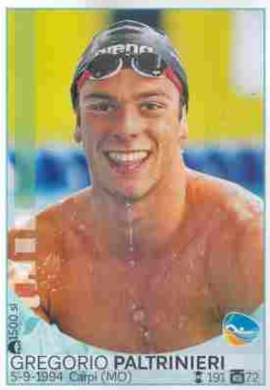
2016 - Gregorio Paltrinieri

Sport e figurine costituiscono un binomio inscindibile. Ma se in molti sanno perfettamente quanto fosse rara la figurina di Pizzaballa, o quanto sia capillare la diffusione nel mondo degli album "Calciatori" della Panini, non tutti sanno come le figurine siano state un mezzo di comunicazione efficacissimo anche dal punto politico, come durante il Nazismo con l'album di figurine fotografiche "Olympia 1936".