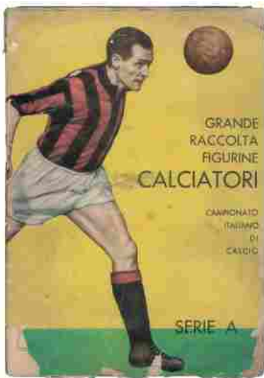
1961-62 - Panini Modena - primo album pubblicato dalla Panini

Accanto alle gesta memorabili nelle sfide olimpiche (la "sconfitta vincente" di Dorando Pietri, la perfezione di Alberto Braglia, la velocità di Nurmi, Zatopek, Mennea e Bolt, la rivoluzione di Fosbury, il 10 di Nadia Comăneci) e del calcio mondiale (da Meazza a Piola, da Yashin a Zoff, da Pelé a Maradona), non mancherà uno sguardo ad aspetti sociali e politici (le vicende di Jesse Owens, Monaco '72, la protesta di Tommie Smith); ai "duelli" che hanno fatto la storia (Coppi e Bartali, Mazzola e Rivera, Prost e Senna, Agassi e Sampras); alle imprese cinematografiche di Johnny Weissmuller, che deposto il costume da piscina indossa quello di Tarzan, o del giovane nuotatore Carlo Pedersoli che sarà conosciuto poi come Bud Spencer.