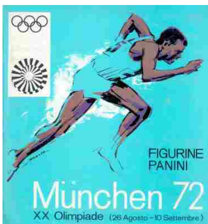
Olimpiadi di Monaco - 1972

Completa la mostra il catalogo I migliori album della nostra vita (Franco Cosimo Panini editore, 2016) che comprende tutte le immagini delle figurine in mostra e i testi di Leo Turrini, Daniele Francesconi e di Paola Basile e Thelma Gramolelli del Museo della Figurina del Comune di Modena. In consultazione e in vendita al bookshop anche l'Enciclopedia Panini del calcio italiano, messa a disposizione da Franco Cosimo Panini.